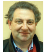
Luc Selis nationaal commissaris postwaardestukken

Briefkaart met zegel van 5ct voor binnenlands gebruik, uitgiftedatum 1 januari 1873. De kaart werd gepost in Liège St-Léonard, een wijk in het noorden van de stad Luik, op 2 december 1875 om 9u 's avonds.